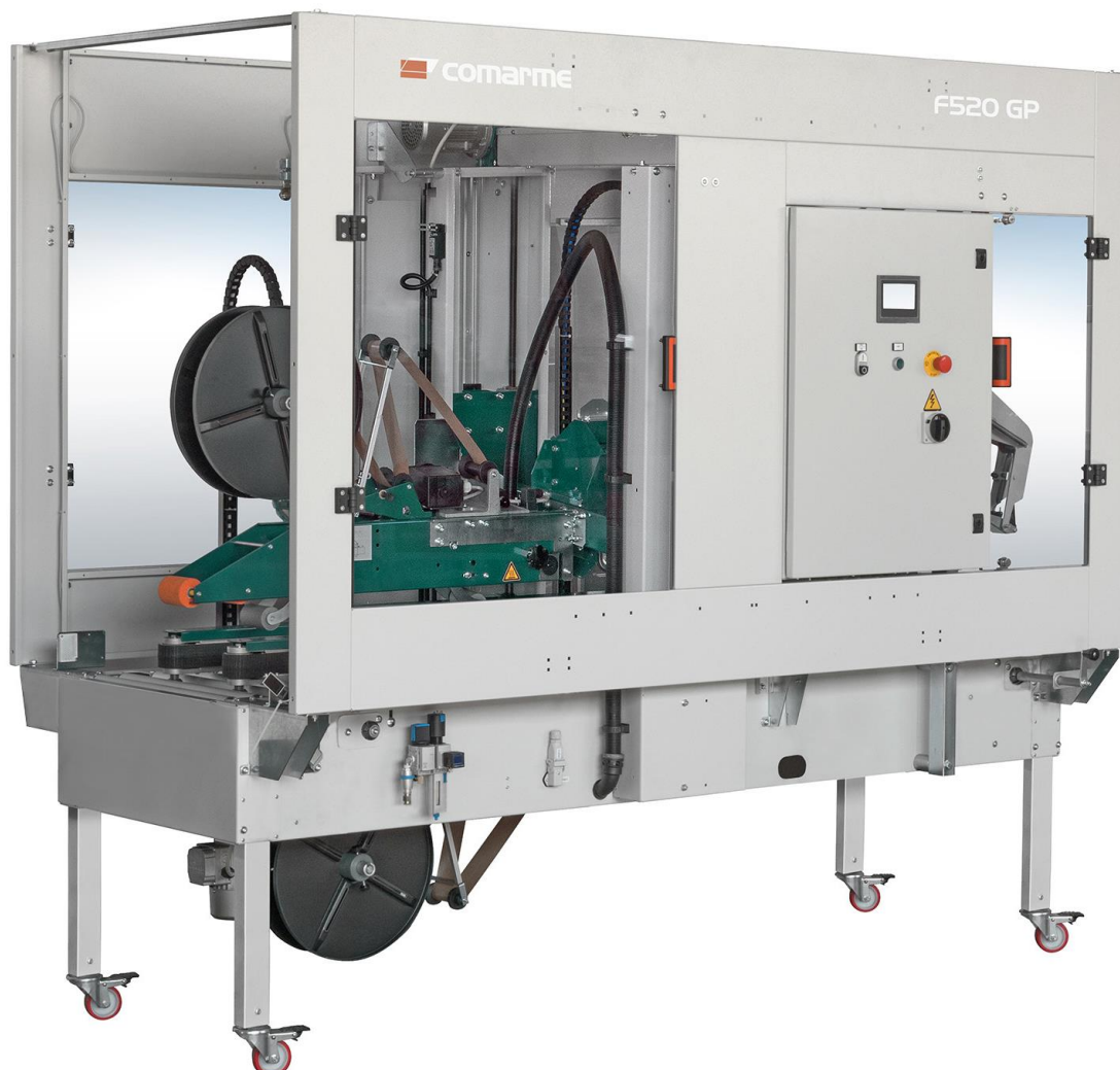
Na zdjęciu: zaklejarka do kartonów firmy COMARME, model GEM F520 GP – do taśmy podgumowanej, z możliwością automatycznego zamykania kłap kartonów

Włoska firma COMARME to światowy lider w produkcji maszyn do zaklejania kartonów. Wśród szerokiej gamy produktów firma oferuje: stacje pakowania (PACKPOINTY), zaklejarki do taśmy podgumowanej, samoprzylepnej oraz składarki kartonów. Firma działa na rynku ponad 100 lat, wykorzystując bogate doświadczenie podczas projektowania kolejnych maszyn.