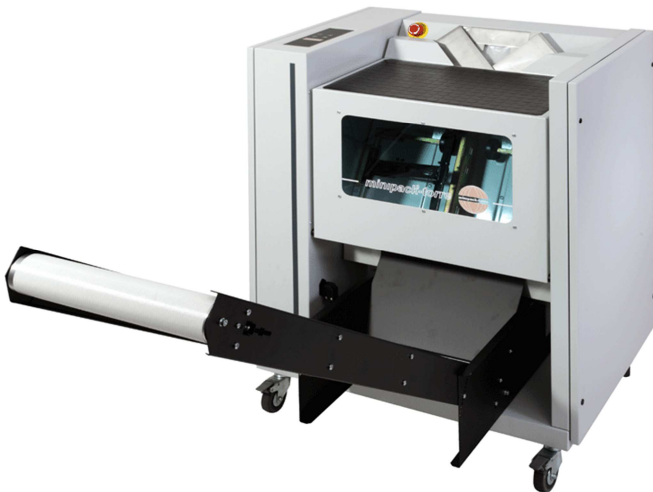
Na zdjęciu: pionowa maszyna do workowania produktów, MAILBAG, włoskiej firmy MINIPACK-TORRE

Pionowe maszyny zgrzewające typu MAILBAG, produkowane przez włoską firmę MINIPACK-TORRE to urządzenia, które bardzo ułatwiają pakowanie prasy i różnych wydawnictw reklamowych w pakiety. Sprawdzają się także, gdy do wydania trzeba „dopakować” próbkę, czy niewielki gadżet. Idealne rozwiązanie dla sortowni i wydawnictw.