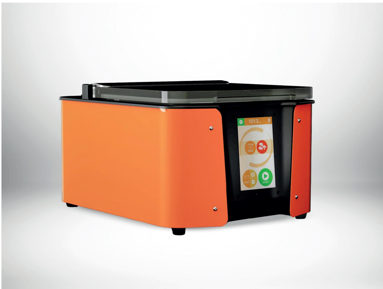
Na zdjęciu: MX2 – nowoczesna, innowacyjna i wszechstronna maszyna próżniowa – niezwykle użyteczna w każdej kuchni; nowość od MINIPACK-TORRE

Seria MX to nowość wśród maszyn do pakowania próżniowego, wytwarzanych przez firmę MINIPACK-TORRE. Pakowarki próżniowe MX przeznaczone są do gastronomii. Nadają się nie tylko do przechowywania żywności w warunkach próżni, ale przede wszystkim – zwiększają różnorodność potraw, jakie można przygotować przy użyciu tych wszechstronnych maszyn.