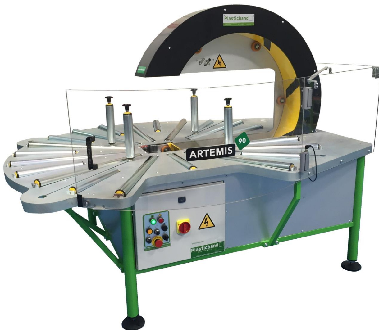
Na zdjęciu: owijarka ARTEMIS-90 firmy PLASTICBAND

Automatyczna owijarka pierścieniowa, model ARTEMIS-90 , została wyprodukowana przez hiszpańską firmę PLASTICBAND . Jest to maszyna przeznaczona do pakowania i zabezpieczania okrągłych przedmiotów takich jak: zwoje węży ogrodowych, zwoje kabli i przewodów elektrycznych, opony, obręcze i pierścienie – w automatycznym cyklu owijania folią stretch.