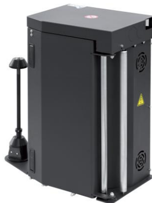
MPS2 – prestretch regulowany płynnie