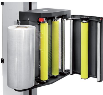
MPS – prestretch regulowany skokowo