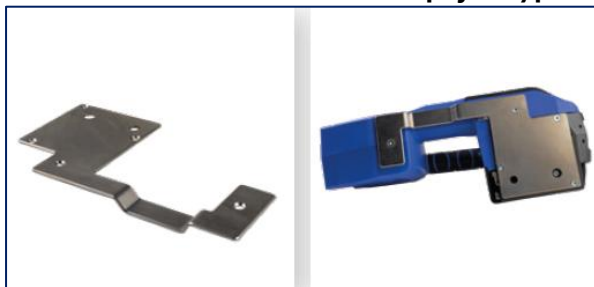
Płyta antycieralna – do użytku na chropowatych powierzchniach