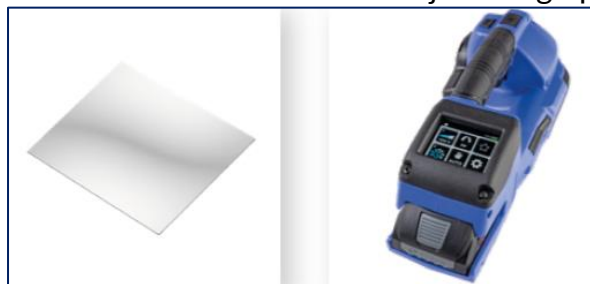
Ochrona wyświetlacza – dodatkowe zabezpieczenie w trudnym środowisku pracy