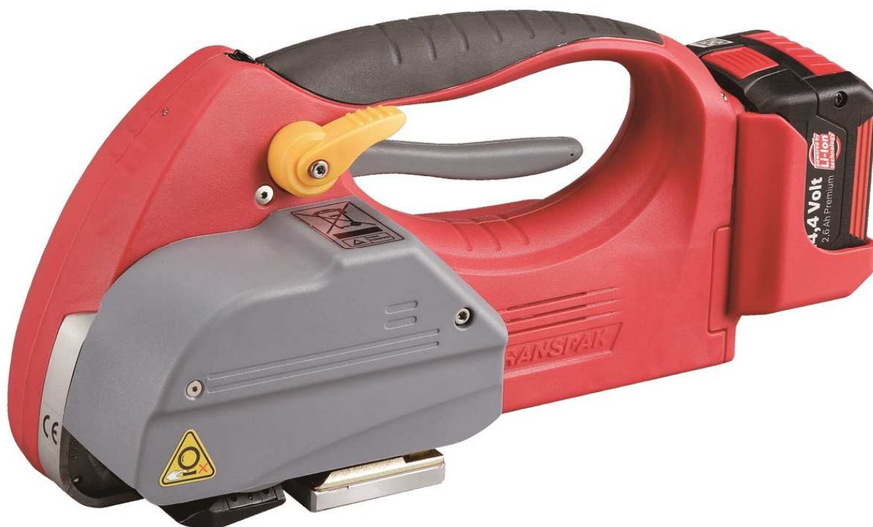
Na zdjęciu: akumulatorowy napinacz do taśm PP/PET, HELIOS model H-45.

HELIOS H-45 to automatyczna wiązarka przeznaczona do zabezpieczania średnio-ciężkich palet i pakietów. Urządzenie bateryjne, co oznacza, że napinanie, zgrzewanie i odcinanie taśm odbywa się w sposób automatyczny. Napinacz HELIOS H-45 jest popularnym narzędziem, do czego przyczyniła się jego wyjątkowo atrakcyjna cena.