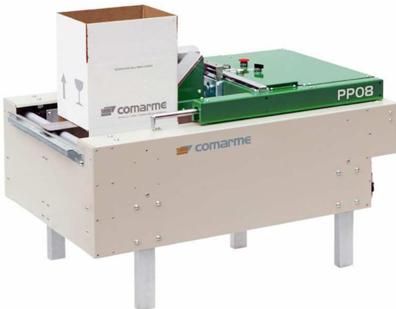
Na zdjęciu: półautomatyczna składarka kartonów, PP 08 firmy COMARME.

Włoska firma COMARME to światowy lider w produkcji maszyn do zaklejania kartonów za pomocą taśmy samoprzylepnej (tzw. SCOTCH). Oferta COMARME to także składarki kartonów – stacje do formowania kartonów i napełniania ich produktami. Firma funkcjonuje na rynku ponad 100 lat, wykorzystując doświadczenie podczas projektowania kolejnych maszyn.