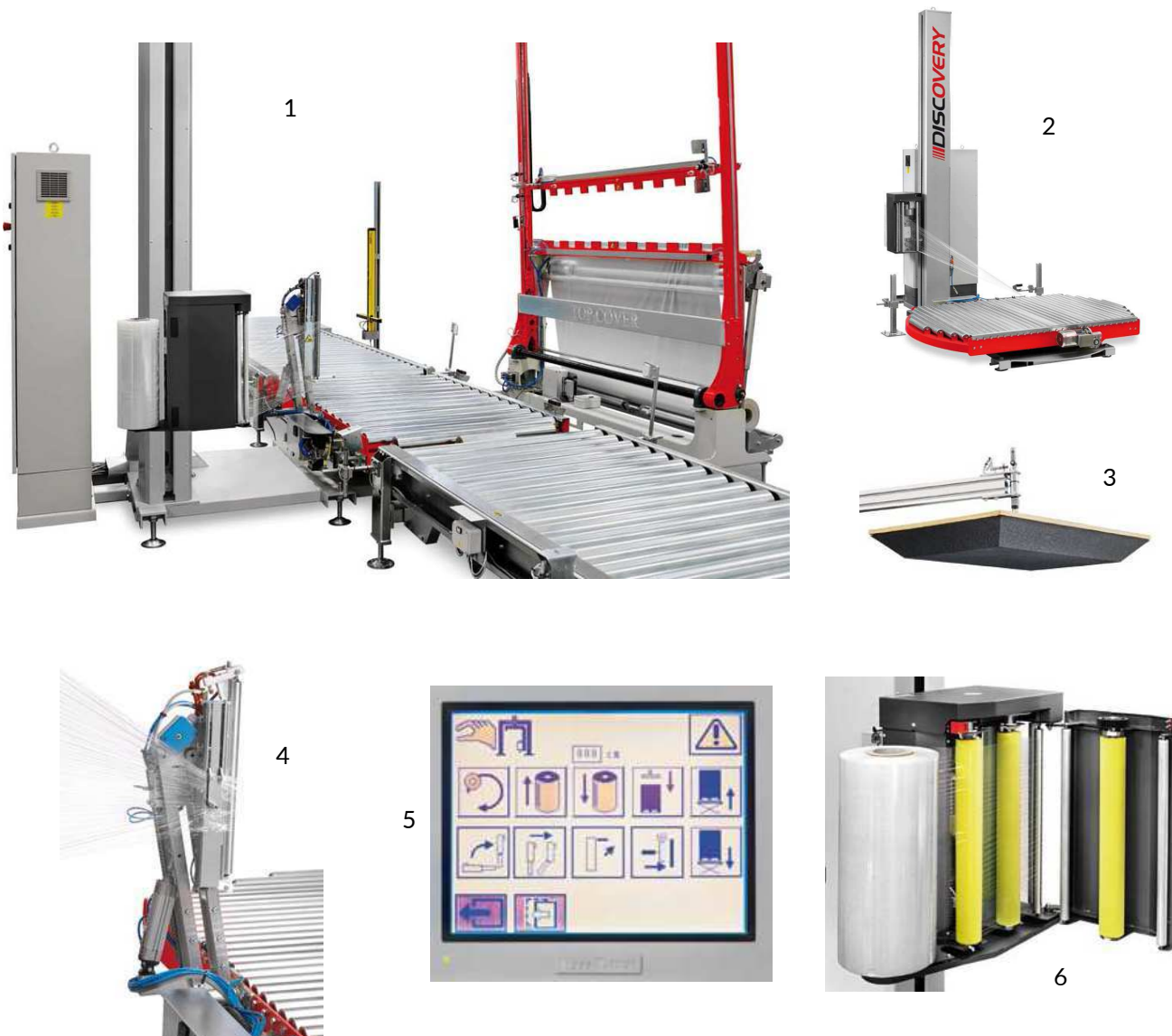
Na zdjęciach powyżej: owijkarka DISCOVERY-A i elementy wyposażenia (szczegóły poniżej)

Owijkarka DISCOVERY-A firmy PKG GROUP jest wydajną maszyną, fabrycznie wyposażoną w podajnik rolkowy lub łańcuchowy. Ta cecha umożliwia szybszy przejazd owijanych palet. Maszyna charakteryzuje się bardzo wytrzymałą i mocną konstrukcją. Ten model owijkarki jest "szyty na miarę", czyli wyposażony zgodnie ze specyfikacją Klienta.